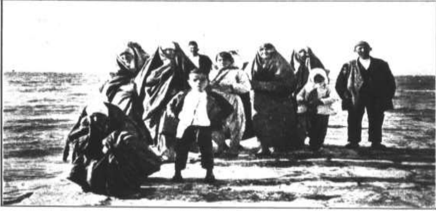
Des sinistres sans abri. Shelterless Turkish villagers.