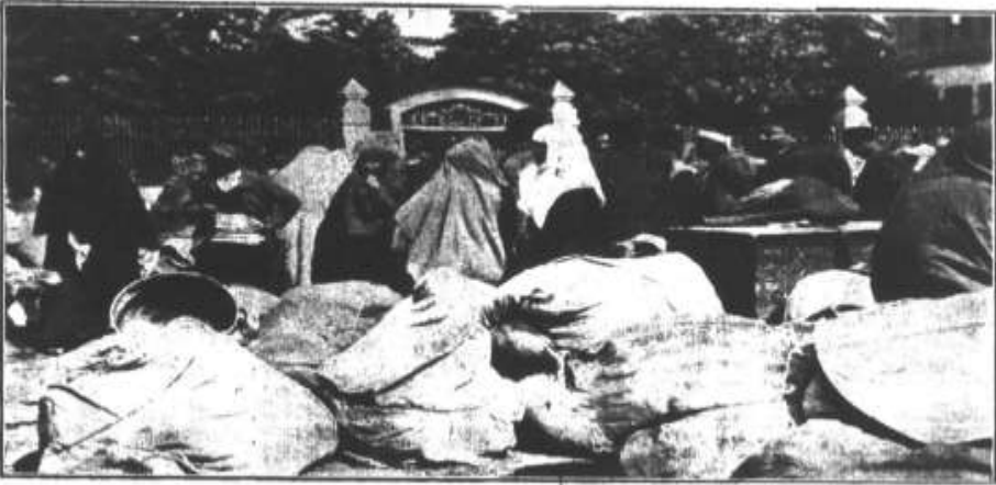
Des sinistres sans abri. Shelterless Turkish villagers.