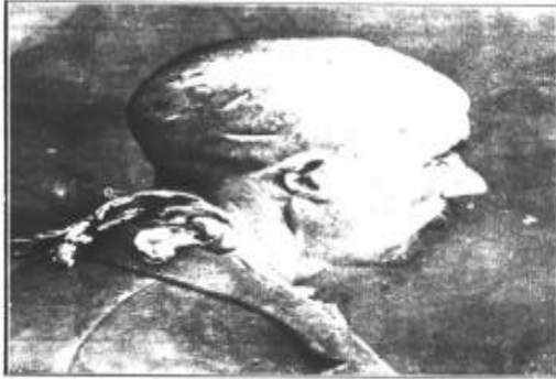
Cheff Admet de Timari, bléssé par les Grecs. SHEFF ADMET FROM TIMARI wounded by the Greeks.