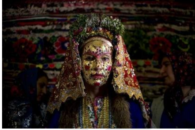
Şekil 2: Gelina uygulaması (URL-2, Erişim Tarihi: 27-07-2021)

Bulgaristan'ın Müslüman bir azınlığı olan Pomaklara aittir ve bu bölgede kullanılan ritüelde gelinin yüzüne sürmek için "belilo" denilen kalın altın rengi metalik bir krem kullanılır. Belilo bir maske gibi pullar ve çiçekli desenlerle süslenerek gelinin yüzüne uygulanır. Son olarak maskenin altında gelinin fiziksel yüz özelliklerine bağlı olarak da kaşlarına sürme çekilir ve dudaklarına ruj sürülür. Bu işlem yaklaşık 2 saati bulur ve genellikle de kadın ziyaretçiler ve akrabaları eşliğinde yapılır. Bazen de bu törenlere profesyonel bir makyaj sanatçısının katıldığı da belirtilmiştir. Düğünden sonra imam tarafından son bir kez dua okunur ve geline damadın evine gidene kadar eşlik edilir, burada gelin makyajını çıkararak ritüel tamamlanır. Gelina geleneği, Pomak kültürüne ait oldukça eski bir kültürdür. Ancak bu geleneğin Sovyet kurallarında yasaklandığı ve durdurulduğu, bu geleneğin yavaşça yok olduğu bilinmektedir (URL-2, Erişim Tarihi: 25-07-2020).