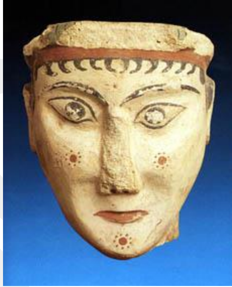
Şekil 1: Miken Uygarlığı'ndan bir yüz boyası gösterimi (URL-1, Erişim Tarihi: 27-07-2021)

Yüz yazma geleneği antik kültürlerde de izlerine rastlanan bir süslenme biçimidir. Miken Uygarlığı'nda bulunan ve Şekil 1'de görülen yüzün bir kadına ait olduğu düşünülmektedir. Neredeyse siyah gibi görünen ama çok derin mavi ile çizilmiş renkler saç ve gözler için kullanılmıştır. Dudaklar ve yanaklarda kullanılan dekorasyonlar ile saç filesi ise kırmızı renklidir (URL-1, Erişim Tarihi: 27-07-2021).