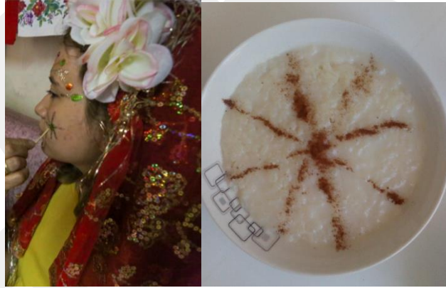
Şekil 9: Güneş motifi uygulaması (Anadolu Ajansı arşivi, Muhabir: Halil Fidan, Fotoğraf: İsmail Duru, Model: Gamze Elmas), Şekil 10: Sütlaç üzerinde güneş motifi (Dilek Himam arşivi).

Yüz yazıcısı Şerife Zorlu, görüşmeler sırasında ikram ettiği yemeklerin, tatlıların üzerine de benzer güneş motifini aktarırken, gündelik yaşama içkinleşmiş olarak bu sembolleri görmek de mümkün olmuştur. Kullanılan semboller iki yanak ve alın ve çene bölgesinde yüzün stratejik noktalarında kullanılır.