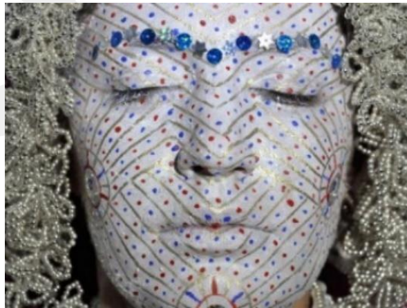
Şekil 3: Kosova'daki yüz yazma uygulaması (URL-3, Erişim Tarihi: 27-07-2021)

Türkiye ve Balkan bölgelerinde az da olsa halen yer aldığı bilinen bu geleneğin bir diğer uygulaması da Kosova'dadır. Burada da yüz yazma geleneği binlerce yıl öncesine gider ve bir sonraki kuşağa geçerek aktarılır. Güney Kosova'da Zhupa bölgesinde 65 yaşındaki bir yaşlı kadının genç gelinlerin yüzlerini yazdığı bilinmektedir. Burada uygulanan yöntemde, gelinin yüzü birçok renk katmanları ile boyanır. Birbiri içinden geçen altın yollar yüzün üzerine çizilir ve bunlar bir yaşamdan başka bir yaşama geçişi sembolize eden 3 altın daireye bağlanır (Şekil 3). İçinden mavi ve kırmızı noktaların çıktığı kırmızı daireler bereketi sembolize eder ve bunlarla tüm yüz kaplanır bu sırada geline sağlıklı ve mutlu bir aileye sahip olması dlenir (URL-3, Erişim Tarihi: 25-07-2020).