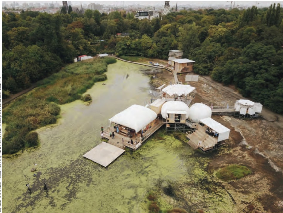
7. Raumlabor öncülüğünde gerçekleştirilen Floating University Berlin (Berlin Yüzen Üniversite) projesi, 2018.