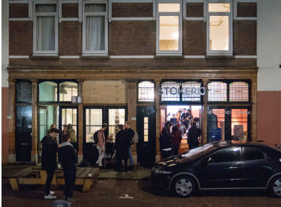
5. STEALTH.unlimited tarafından City in the Making (Yapımdaki Şehir) projesi kapsamında gerçekleştirilen "De Stokerij" projesi.