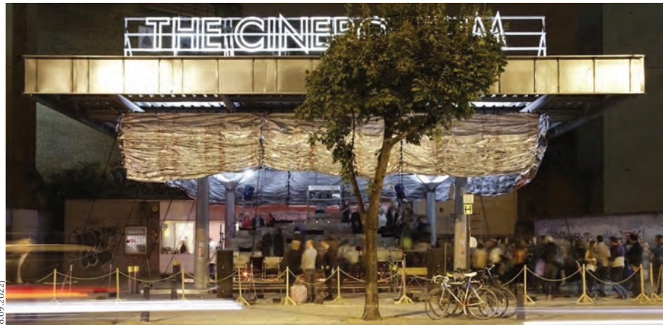
12. The Cineroleum: Assemble kolektifinin kendi imkanlarıyla Londra'daki Clerkenwell Yolu üzerinde terk edilmiş bir benzin istasyonunu sinemaya dönüştürmesi, 2010.

nın ötesinde, 14 mimarların ve mimar olmayanların bilgi ve becerilerini harmanlayan, arada öznelliklerin oluşumunu ön plana çıkaran geniş bir bilgi alanı olarak tariflemek mümkündür.