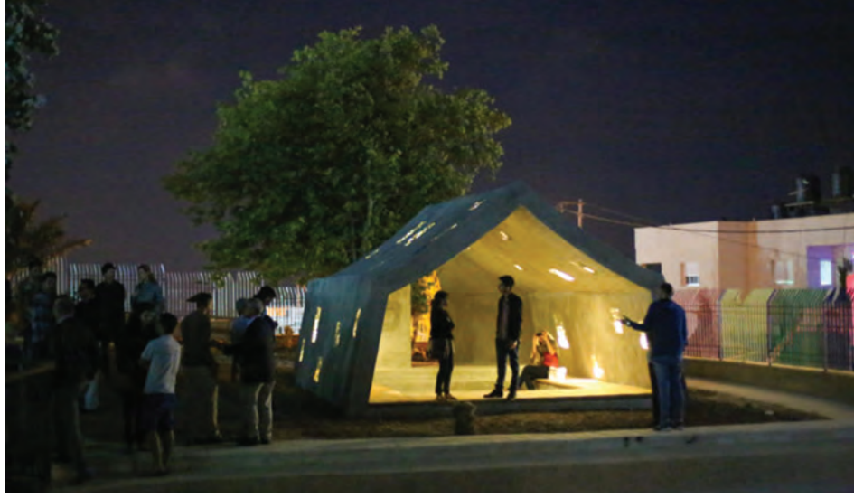
3. DAAR tarafından gerçekleştirilen, kalıcı geçicilik paradoksunu temsil eden The Concrete Tent (Beton Çadır) çalışması. Dheisheh Mülteci Kampı'nda "Kamplarda Kampüs" (Campus in Camps) projesi kapsamında inşa edilen Beton Çadır, ortak öğrenme, değişim ve tartışma alanıdır.