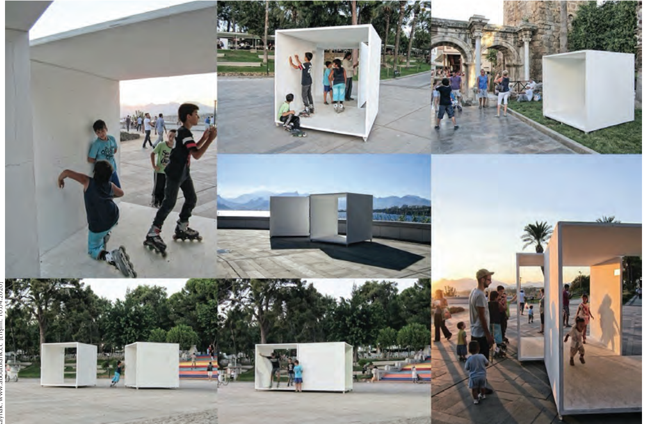
10. Açık-kaynak mimarlık deneyimi olarak Küp: Aboutblank'in II. Uluslararası Antalya Mimarlık Bienali için hazırladığı kamusal yerleşime, 2013.

Mekânda yer alan iki farklı eylem yaklaşımının yanı sıra belirli bir mekândan bağımsız olarak gerçekleşen mekânsal pratiklerin de olduğu görülmektedir. Bu pratiklerde eylemi, yeni araç ve yöntemlerin geliştirilmesi ve test edilmesi olarak gözlemlemek mümkündür. Diğer uygulamalı yaklaşımların aksine bağlamı daha kap-