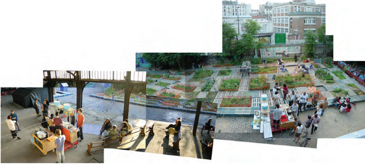
6. Paris'in kuzeyindeki La Chapelle bölgesinde Atelier d'architecture autogérée (aaa) tarafından gerçekleştirilen Ecobox projesi, 2001-2006.

lenebilir. Daha kapsamlı değerlendirildiğinde mekânın, aktörlerin sosyal ve politik örgütlenmeye yönelik tahayyüllerini, dolayısıyla eylemlerinin gidişatını sırasıyla yansıtan, koşullandıran ve karşılayan belirleyici bir faktör haline geldiğini söylemek mümkündür. Sosyo-ekonomik, politik, fiziksel ve ölçek açılarından farklılaşan bu bağlamlar, alternatif mekânsal pratikler için itici bir güç, güç ilişkilerini yeniden düzenlemek ve toplumsal açılımlar kazandırmak için bir uygulama zemini veya aktörlerin deneysel yaklaşımları için bir kanal sunar. Her koşulda, bu alanların doğrudan ya da dolaylı olarak kapitalizmin kırılmalarına temellendiği; dolayısıyla, krizlerin bağlamsal bir karşılığı, mekânsal pratiklerin içeriğini şekillendiren bir ölçüt olduğu söylenebilir.