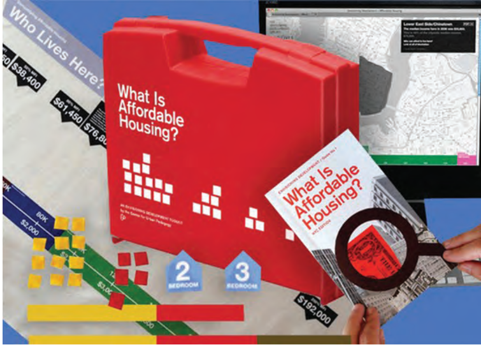
13. What is Affordable Housing (Uygun Fiyatlı Konut Nedir?), toplulukları konut politikaları hakkında bilgilendirmek için çevrimiçi etkileşimli bir harita, kılavuz ve grafikler içeren bir araç seti, CUP (Center for Urban Pedagogy).

Kaynak: http://welcometocup.org/ [Erişim: 28.09.2022]