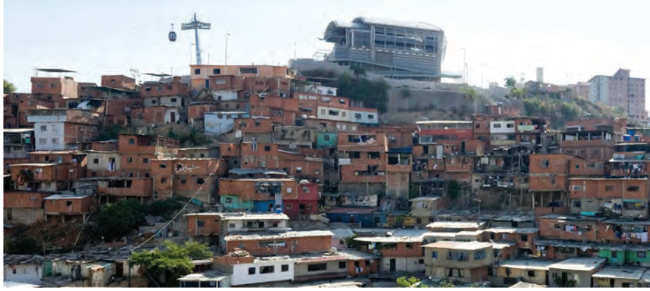
4. Toplumsal yapılanma hedefiyle Caracas'a bağlı San Agustín gecekondu yerleşkesinde gerçekleştirilen Metro Cable projesi, Urban-Think Tank, 2010-2011.

Kaynak: http://www.campusincamps.org/projects/the-concrete-tent [Erişim: 28.09.2022]