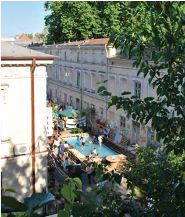
8. Geçici kamusal yerleştirme: The Public Bath (Kamusal Banyo), Bükreş, 2012

tik yaklaşımların şekillenmesinde bağlam kadar önemli bir rol oynar. Kriz karşısında oluşan hoşnutsuzluğun bir tezahürü olarak karşımıza çıkan eylem, işbirlikçi ve süreç odaklı bir mekânsal üretim anlayışıyla, yatay örgütlenme ve merkez dışı bir arayışı temsil eder. Margaret Crawford'un belirttiği gibi, kapsayıcı olduğu kadar hangi strateji ve taktiklerin kullanıldığı sorusuna da açık olan bu arayışlar, çoklu müdahalelere kapı aralamaktadır. 13 Yapısalardan düşünsele, bir başka deyişle, fizikselden fikirsele uzanan geniş bir yelpazedeki eylemler, çizimler, eskizler ve imajlar yoluyla biçimsel ve tektonik arayışlara karşılık gelen bir mimarlık anlayışının aksine, farklı araç ve yöntemlerin uyarlandığı, mekânda ve/veya mekândan bağımsız gerçekleşen çeşitli operasyon ölçeklerine karşılık gelir. Bu açıdan bakıldığında, mekân özelinde gerçekleşen eylemleri iki farklı şekilde konumlandırmak mümkündür: Bunlardan ilki, mekânsal sorunların çözümünde doğrudan etkileşim ve aktif katı-