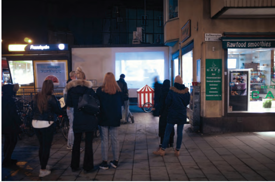
9. Mobile Cinema (Hareketli Sinema): Stockholm'deki ArchFilmSthlm film festivali kapsamında Dis/order tarafından üretilen geçici bir kamusal yerleşime, 2015.

İlim yoluyla etki yaratmayı amaçlayan, mekânın fiziksel üretimindeki fiili müdahaleleri içerir. İspanya'daki ekonomik krizin sonucu olarak inşası yarıda kalmış ya da terk edilmiş yapılara çoğunlukla yasa dışı müdahalelerde bulunarak gerilla mimarı olarak tanınan Santiago Cirugeda'nun hareketli ve hızlı-inşa edilebilir sistemler aracılığıyla bu yapıları işgal etmesi; Assemble kolektif üyelerinin viyadük altındaki kayıp mekânda sanat etkinlikleri aracılığıyla yeni bir kamusal alan inşa etmesi veya bir petrol istasyonunu sinema salonuna dönüştürmesi gibi pek çok örneğin ortak noktası, umulma-