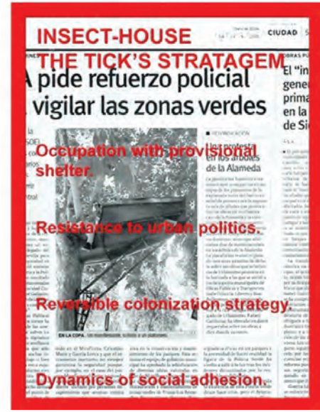
11. Recetas Urbana'nın medyanın ilgisini çeken yıkıcı işgal stratejileri: Skips – Sokağı Geri Kazanmak (sol üst); Scaffolding - Bir Kent Rezervi İnşa Etmek (sağ üst); Kapsül 1 (sol alt); Insect House (sağ alt).